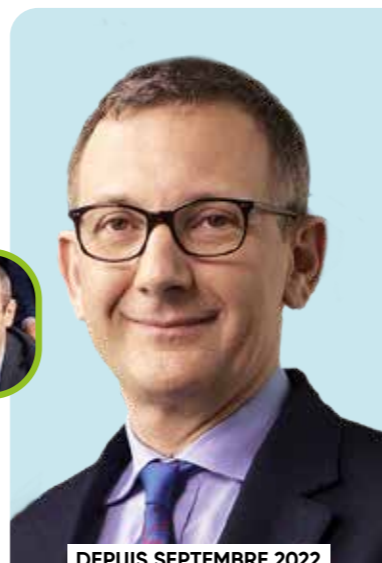
DEPUIS SEPTEMBRE 2022